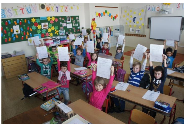
Radost z prvního vysvědčení

Kvalitní vzdělávání našich žáků se odráží také v umístování v soutěžích a ve výsledcích přijímacího řízení na střední školy. Nesmírně cennou je pro nás zpětná vazba od absolventů. Informace o úspěšnosti studia na střední škole svědčí o tom, že odcházejí ze základní školy dobře připraveni.